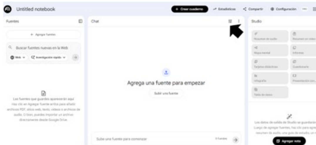
Imagen 2. Interfaz operativa de un cuaderno de NotebookLM®

Se observan los paneles de "Fuentes", "Chat" y "Studio", utilizados para la síntesis de información y la organización de la literatura científica analizada. La flecha marca dónde configurar el chat 7